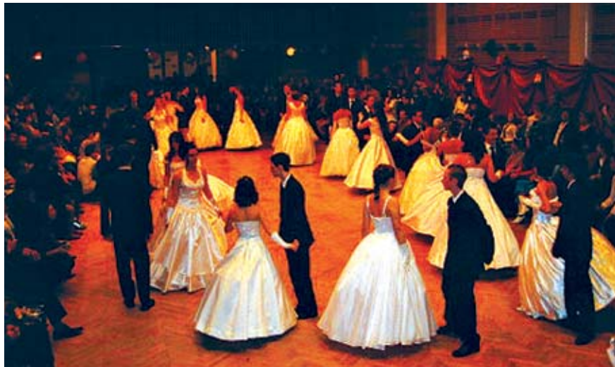
(A szalagavató bálról készült fotót az iskola bocsátotta rendelkezésünkre)