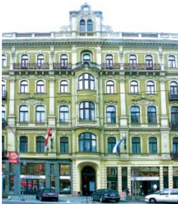
Az Erzsébet körút 6. szám alatti Polgármesteri Hivatal központi telefonszáma változatlanul: 462-3100.

A polgármesteri hivatal irodáinak munka- és ügyfélfogadási rendje nem változik. Az oldalon keretben megtalálhatják az irodák, illetve az okmányiroda, az ügyfélszolgálati irodák, és a pénzügyi iroda adócsoportjának az ügyfélfogadási rendjét.