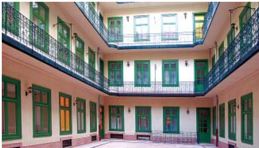
A Garay utca 5. szám alatti irodaház február 4-től működő központi telefonszáma: 462-3300.

Az Erzsébet körúti, a lakosság által már ismert hivatali épületben pedig a polgármester, az alpolgármesterek, a jegyző, a jegyzői iroda, és az aljegyző, mellett megtalálható lesz a beruházási csoport, az EU integrációs és informatikai csoport, a hatósági iroda, a