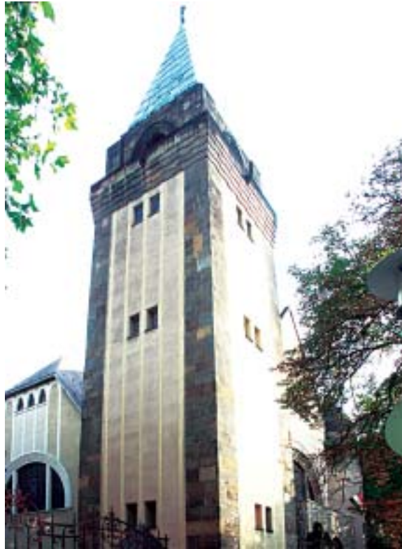
A Fásori Református Templom épülete a Városligeti Fásor 7. szám alatt

együtt számos magyar egyházzrész, így az egész Erdélyi kerület és gyülekezetek csoportjai kerültek határainkon kívülre. Ezek ősi lakhelyükön élnek ugyan, de idegen nyelvi és vallási környezetben folytatják életüket. Az Amerikai Egyesült Államokban két különböző egyházi szervezetben, összesen hetven magyar református gyülekezet él. Ezenkívül Kanadában, Nyugat-Európában, Ausztráliában, Latin-Amerikában élnek magyar reformátusok. A környező országokban és a világon szétszórta élő magyar reformátusokkal a Magyarországi Református Egyház szoros testvéri kapcsolatokat tart, részben a Magyar Reformátusok Világszövetsége, részben a Magyar Református Egyházak Tanácskozó Zsinatának keretei között. Ma az ország tízmillió lakosságának körülbelül 21 százalékát teszik ki a reformátu-