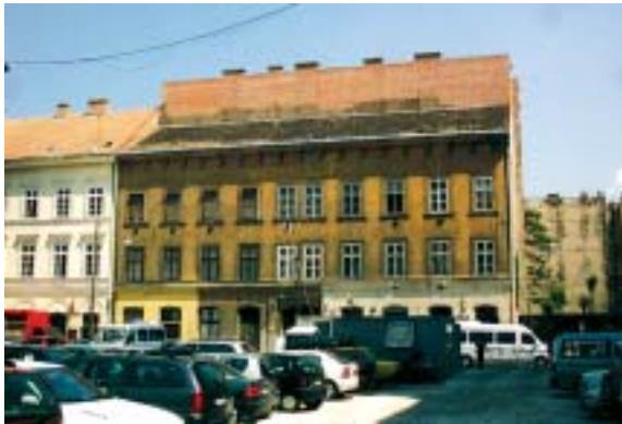
A Rumbach Sebestyén utca napjainkban...

nyeges javulását, nem akarták megérteni, hogy mit is jelent az a hozadék,