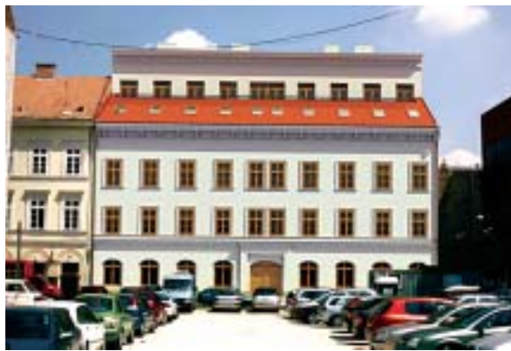
...és a látványterven

amivel értékben minden egyes ingatlan a házban a beruházás után többet fog érni. (Többek között teljes tetőcsere, külső-belső homlokzat felújítás, 2 darab lift beépítése, kulturált lakókörnyezet kialakítása.) A kisebbségben lévők irreális